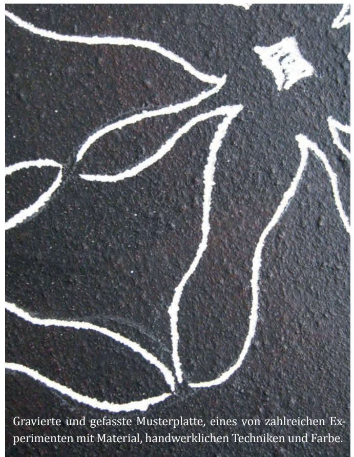
Gravierte und gefasste Musterplatte, eines von zahlreichen Experimenten mit Material, handwerklichen Techniken und Farbe.

Möchten Sie, dass unser Redaktionsteam Sie besucht und Ihren Betrieb in der Oberer-Zytig vorstellt? Dann schicken Sie uns ein Mail an redaktion-oz@oberwinterthur.ch